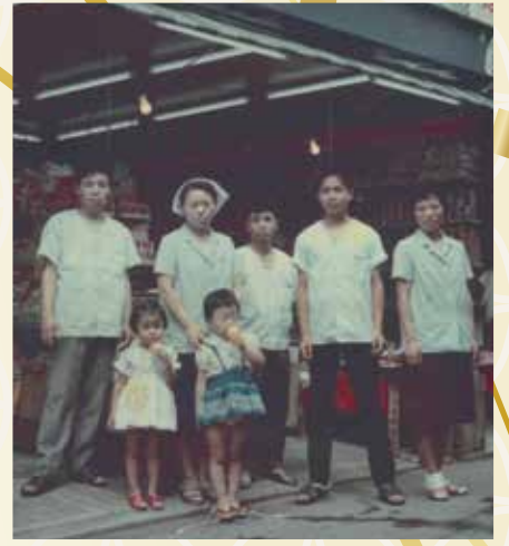
これぞ下町の商店街