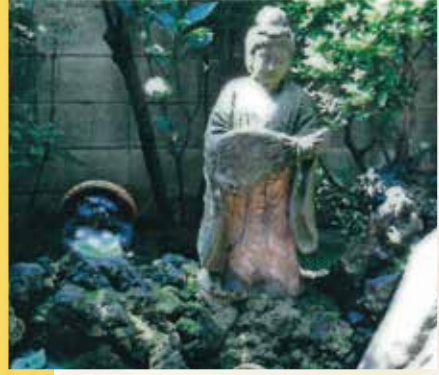
数奇な運命をたどった弁天様