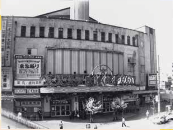
「57.5.1国際劇場閉館」