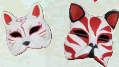
狐面の絵付けにチャレンジしよう