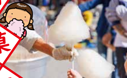
来場したちびっ子たちに、ふわふわのおいしい綿菓子をプレゼントします。